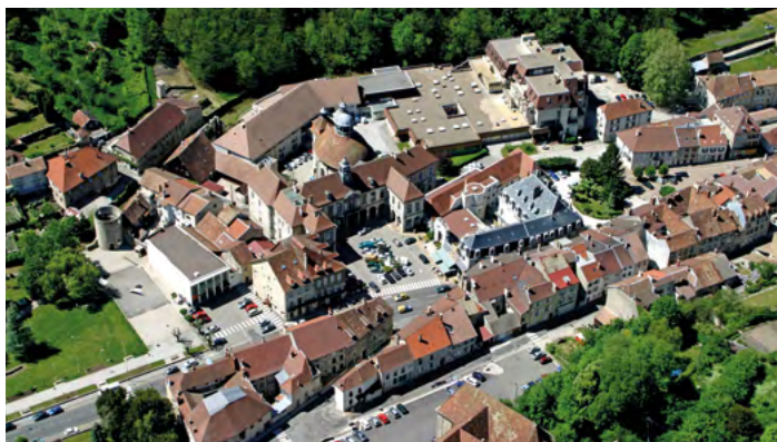
Deux dispositifs pour soutenir les nouvelles ruralités

La Bourgogne-Franche-Comté est un territoire à dominante rurale, une force sur laquelle la région veut s'appuyer.