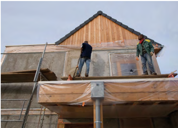
Extension du dispositif pour la réalisation d'audits à destination des particuliers

La région déploie, dès janvier 2017, sur l'ensemble de la région, plusieurs dispositifs du programme de rénovation du bâti au niveau bâtiment basse consommation (BBC), « Effilogis », initialement mis en place en Franche-Comté.