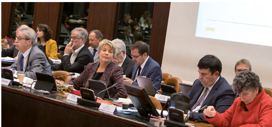
Adoption par les élus régionaux du budget primitif pour 2017

Les élus, réunis en assemblée plénière les 12 et 13 janvier à Dijon, ont adopté le budget primitif de la région Bourgogne-Franche-Comté pour 2017, d'un montant de plus de 1,5 milliard d'euros.