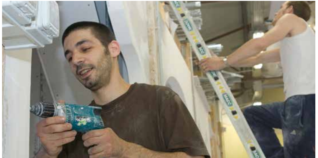
Au titre des investissements, la région poursuit son soutien au secteur du bâtiment et des travaux publics en Bourgogne-Franche-Comté.

Les élus, réunis en assemblée plénière vendredi 29 avril à Dijon, ont adopté le premier budget primitif de la région Bourgogne-Franche-Comté pour 2016, d'un montant de plus d'1,3 milliard d'euros.