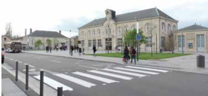
L'Europe contribue à l'aménagement du pôle d'échange multimodal de Dole.

Depuis 2014, près de 50 projets ont été financés par des fonds européens et accompagnés par les services de la région. Exemples avec l'entreprise Danielson, sur le technopôle de Nevers Magny Cours, dans la Nièvre, ou avec l'aménagement d'un pôle d'échange multimodal à Dole, dans le Jura.