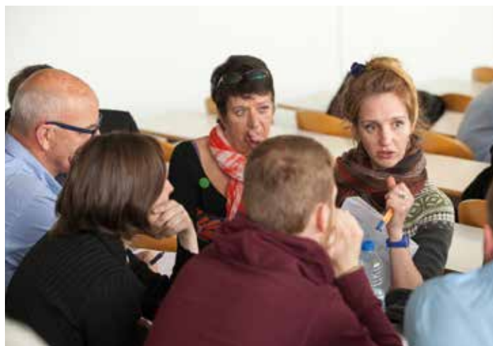
Les acteurs de l'Économie Sociale et Solidaire de Bourgogne-Franche-Comté réunis pour la première fois.

Près de 130 professionnels ont répondu à l'invitation de la région qui organisait, lundi 25 avril à Besançon, le premier atelier participatif consacré à l'économie sociale et solidaire.